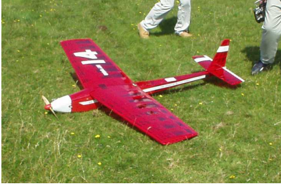
Mannin Beach, Ireland, 13. August 2003